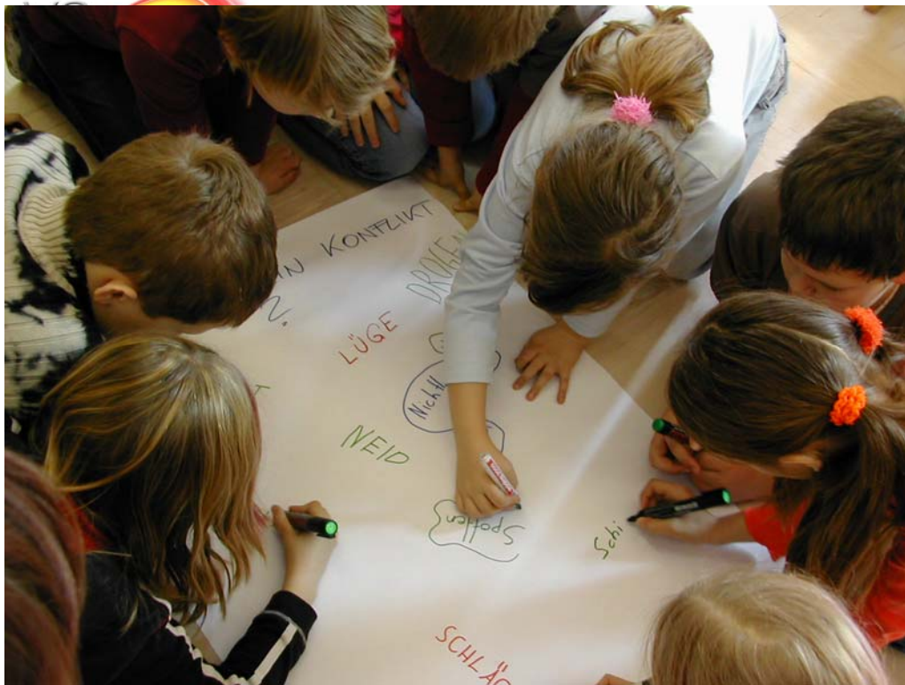
Gemeinsames Arbeiten , Erstellen, Erkennen.....