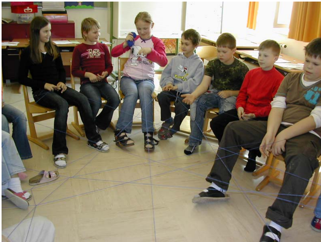
Gemeinsames verbindet!!!!!! Jeder trägt etwas bei!!!!