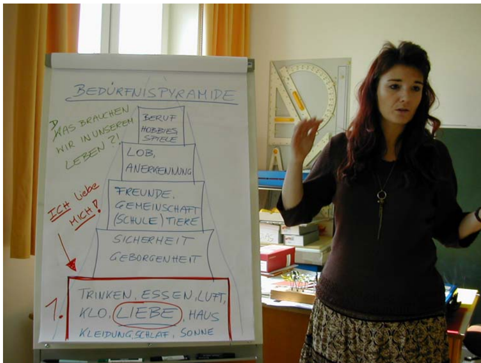
Meine Grundbedürfnisse.....Ich brauche.....